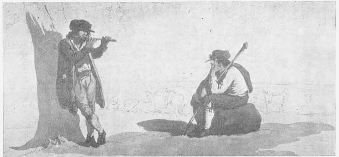
BARTOLOMEO PINELLI - Composizione (Mostra del Pinelli a cura degli « Amici dei Musei » di Roma, a Palazzo Braschi, maggio-settembre 1956)

Colpiscono attraverso alla viva vicenda di scambio amichevole e impegnativo che furono per lei le lettere, due caratteri-