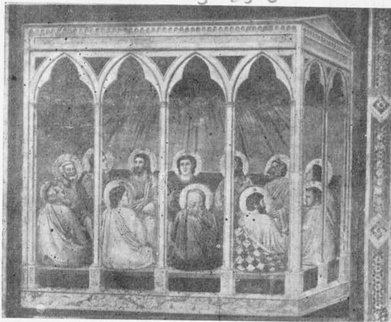
GIOTTO - La Pentecoste (Cappella degli Scrovegni, Padova)

Nella luce della Fede allora non siamo più quelli di prima: le nostre dimensioni sono più piccole perché sentiamo e accettiamo di essere creature totalmente dipendenti da Dio, ma per un altro verso sono anche più grandi perché ci sentiamo veri figli di Dio, scopriamo la nostra sublime dignità di esseri