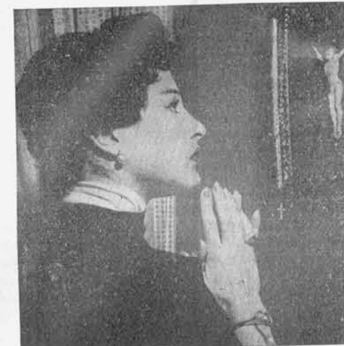
Possono le attrici rinunciare almeno alla pubblicità... religiosa?

Sono queste cose su cui dobbiamo riflettere attentamente e spregiudicatamente, senza crearci facili alibi, senza darci in mano all'illusione, senza credere di poter assolvere alla nostra missione nella vita lavorando nella maniera migliore solo al di fuori della nostra attività professionale.