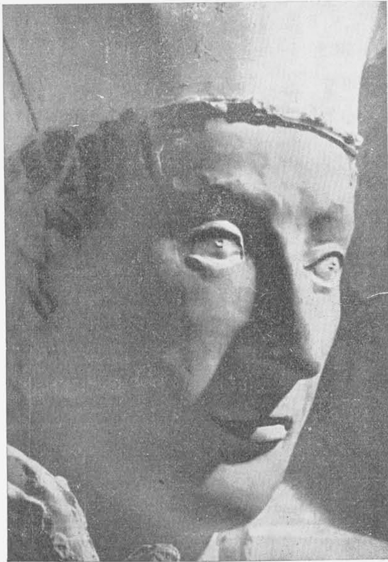
Arturo Martini: La Chiesa (particolare)

L' Annunciazione , opera distrutta dalla guerra, era di sapore arcaico, con la Madonna assisa in un rustico sedile e con un canestro di fiori sul grembo, in atto di attento ascolto delle parole del messaggio divino recatoLe da un angelo apparso