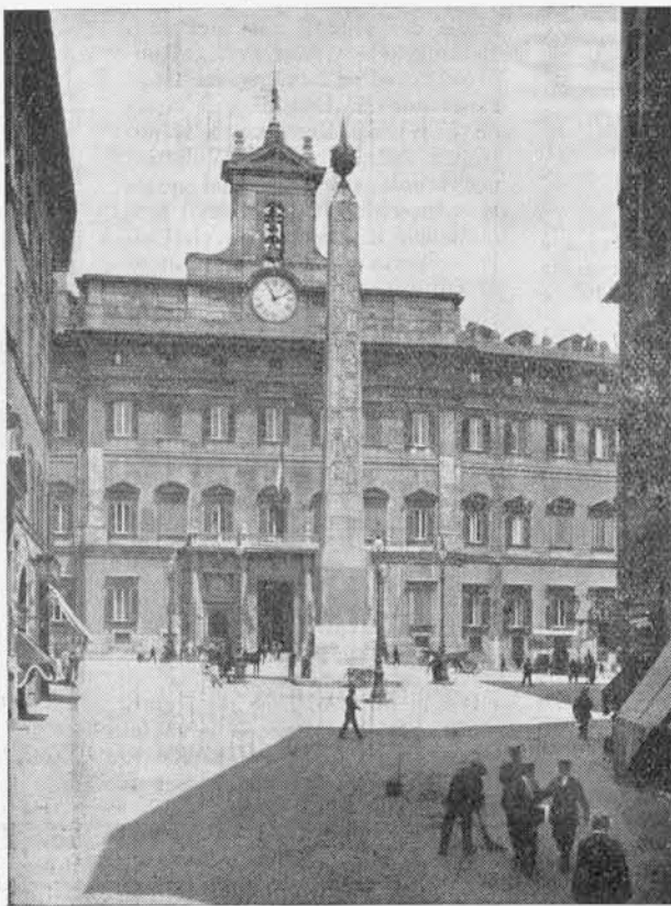
Piazza Montecitorio e il palazzo della Camera dei deputati in una vecchia fotografia.

Già nel 1876 Roberto Stuart, parlando all'Associazione Costituzionale di Perugia, aveva detto: « Di tutto par-