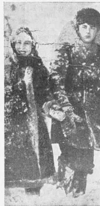
Una scena da « Il ritorno di Vassili Bortnikov », regia Vsevolod Pudovkin, dal romanzo « La messe » di Galina Mikolajeva (lunghezza del film: m. 2966; produzione « Mosfilm », Mosca, 1953)

Per me il dramma di Vassili è un dramma dei contorni umani le cui linee fondamentali restano nell'alveo di quei motivi perenni di cui la vita dell'uomo è intessuta in ogni tipo di società. Il fatto che un uomo cerchi nel lavoro la soluzione o la rivalsa di una infelicità familiare è un fatto umano che non è prerogativa di una particolare struttura economica. E altrettanto umani sono sia l'ostinazione nel cercare dei colpevoli in un fatto