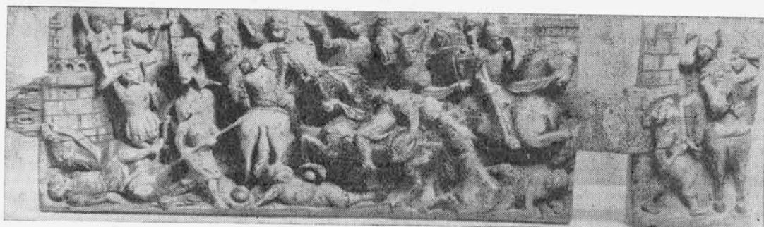
Scultura in legno per un carretto siciliano, opera di artigiano anonimo privo di qualsiasi scuola che non sia quella della « bottega »

Nella stessa sala pregevoli, oltre alle figure di Sironi ma stacciate e solidamente impostate, le tre opere di Pippo Rizzo