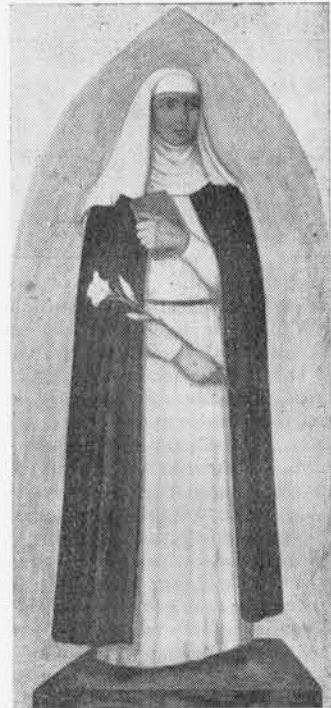
N. CODINO (UCAI) - « Santa Caterina da Siena » (Cappella reggimentale del IX Artiglieria, Lucca; tempera su tavola a fondo oro, grandezza naturale - 1952)

Il Convegno, oltre che ai futuri studenti d'arte, è quindi aperto — per quanto si diceva prima — ai giovani artisti e laureati che uniscano alla preparazione e competenza in questa materia, una buona formazione religiosa e morale e che possano portare un effettivo contributo all'approfondimento del tema del Convegno.