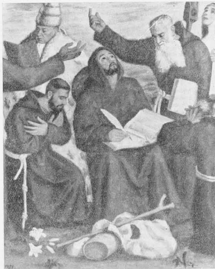
P. UGOLINO DA BELLUNO - « Regina Ordinis Minorum » (particolare)

Nella parte superiore qualche preoccupazione di più. Ma anche qui uno sfumare di colori, un