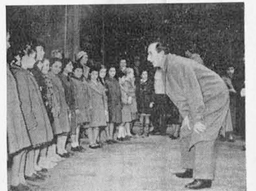
La fabbrica delle illusioni: si esaminano le aspiranti dive.

Non siamo anche noi, qualche volta, portati alla tentazione di aver poca fiducia nella forza penetrativa della Parola di Dio o di nutrire poca fiducia nelle capacità di comprensione e di amore del fratello che ci passa accanto? Non siamo anche noi spesso tentati — sia pure inconsciamente — di aggiustare e di adattare alla nostra meschina umanità l'eterna e grandiosa verità di Dio, con la scusa di renderla più comprensibile agli uomini di oggi? Non dobbiamo anche noi fare un attento esame di coscienza e batterci, pentiti, il petto?